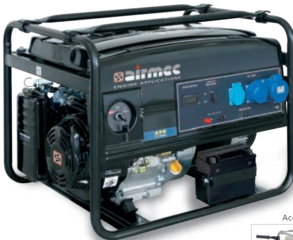
Accessorio - Accessory